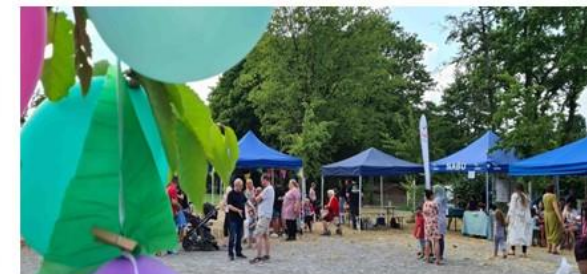
Quartiersmanagement Bochold: Sommerfest Haus-Berge-Park (Juni 2023)